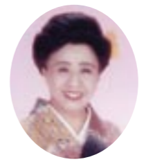
初代コロムビアローズ (ゲスト)