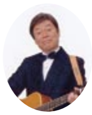
塚すすむ (歌謡漫談)