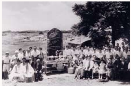
文蔵報徳碑除幕式

治八年〜昭和三十六年）の頌徳碑が建っています。この碑も昭和三十年、当時の稲敷郡内の農家や有志の方々の寄付金で建てられました。勘之助は文蔵とは異なつた方法で農民のために尽くしたので、碑の建立がきつ