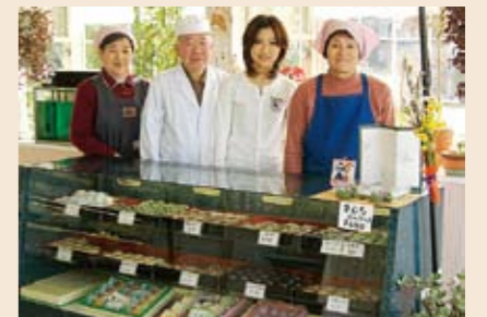
皆さまのご来店を、心よりお待ちしております。