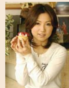
イチゴタルト美味しかったですよ。