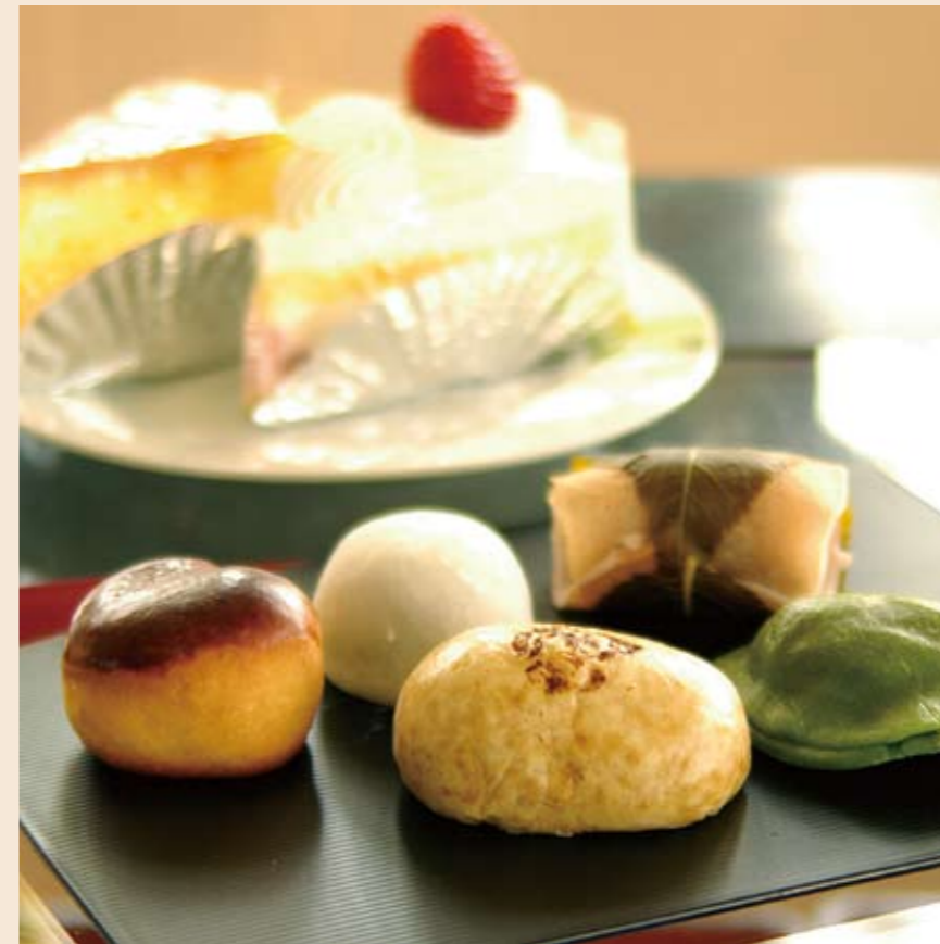
どちらもおいしい和菓子と洋菓子。あなたはドッチ派？

もう一つは、陶芸界で頂点となる日本陶芸展を狙っているわけ。食器なのか、前衛的なオブジェなのかまだ決めてないけど、この展示会にぜひ出品したいなあ。