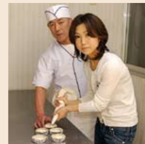
カップケーキづくりに挑戦してみました。