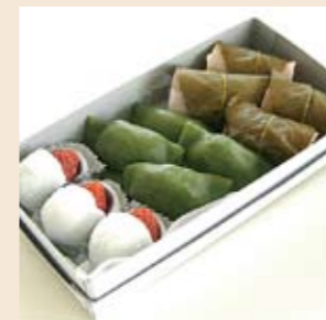
プレゼント商品です。※写真と異なる場合あり。