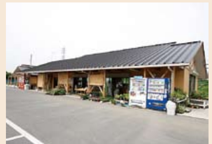
稲敷直売所で取り扱っています