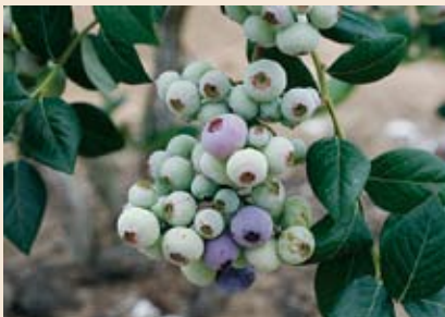
木になっているブルーベリーの実。熟すと緑から濃い青紫色になります