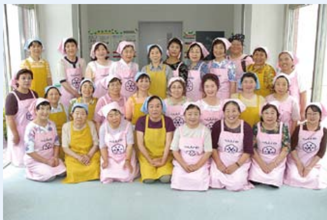
今回の料理に挑戦していただいた稲敷市食生活改善推進員協議会新利根支部(ヘルスマイト)のみなさん