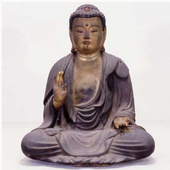
写真①：木造弥勒如来坐像

安穩寺のご本尊は弥勒如来 (市指定文化財) (写真①)という仏様です。弥勒と聞いて、有名な京都太秦・広隆寺の弥勒菩薩半跏思惟像 (みづくぼさはんかしいぞう) を思われる方もいると思います。広隆寺の弥勒像は、半跏思惟像 (はんかしいぞう) の片足を踏み下げ、