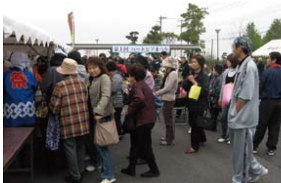
大人気の模擬店はすぐに完売