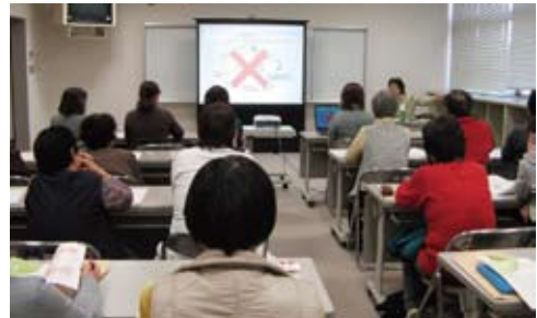
熱心に耳を傾ける参加者

認知症になっても住みよいまちづくりを目指し、今後もサポーター養成に取り組んでいきます。「今回の講座は聞き逃してしまったが、ぜひ聞いてみたい」という方、21年度以降も養成講座を随時開催していきたいと思います。興味・関心のある方は、ぜひ市地域包括支援センターまでお問い合わせください。