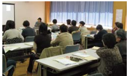
認知症を理解しました