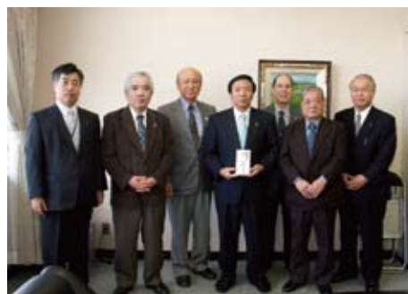
稲敷市商工会(文化祭チャリティーガラポン)