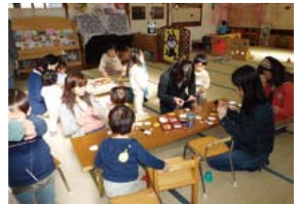
モビール製作。パンダ、うさぎ、アンパンマンと表情豊かなモビールに仕上がりました。

材料を利用して、色々なおもちゃ製作を行っています。今回は、牛乳パックを利用してパクパク人形作りに挑戦して頂く予定です。親子で切ったり張ったり製作を楽しみましょう。