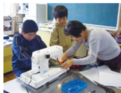
▲地域の方のボランティア

ご意見を！ 市民のみ なさんのご意見、ご提案 を今後の編集に反映 していきたいと思いま す。秘書広聴課まで