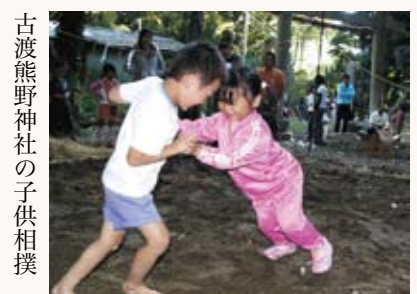
古渡熊野神社の子供相撲

こうして古い由緒をもつ神社を村の鎮守として尊崇しながら生活していた人びとが、秋の収穫を感謝して祭礼に相撲を奉納したのがはじめなのでしょう。境内では稲穂を燃やし焚火をしており、私達にまでおいしいおにぎりをいただきました。