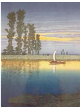
版画「牛堀の夕暮」（昭和5年）川瀬巴水 画