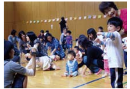
子育て運動会(10月8日)