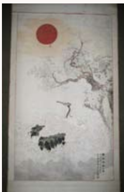
③ 掛軸(秋本市郎兵衛蔵)