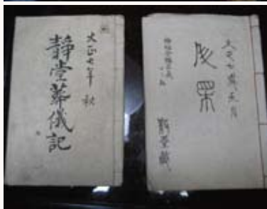
④ 富澤家文書(富澤家蔵)