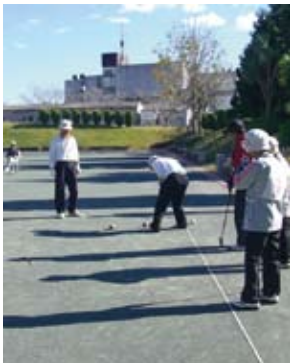
▲ゲートボール大会