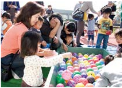
あいアイフェスティバル(10月31日)

です。「まちのおんがくやさん」による音楽コンサートも楽しめます。どうぞご家族そろってお越しください。