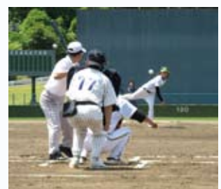
桜川地区球技大会

これからは、12月20日(日)に桜川地区ロードレース大会、平成22年2月14日(日)に新利根地区ハイキング(房総方面)を予定しています。どうぞ、ご参加ください。