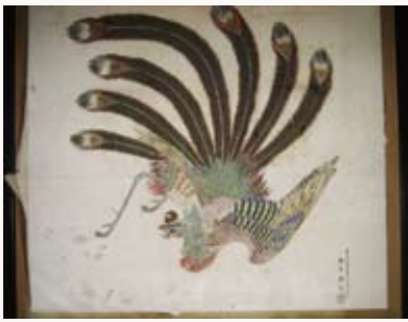
② 大鳳衝立(香取神宮蔵)