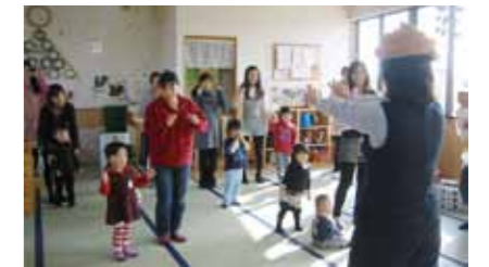
△栄養講座うんちサンバ

▽日時：センターつばさ=1月10日(火)、17日(火) /センターひまわり=1月11日(水)、18日(水) 午前10時20分～