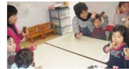
△ほっかほっかのお芋はおいしいな！

▽持ち物：動きやすい服装、運動靴、飲み物、タオル(汗拭き) ▽申込：1月13日(金)までにあいアイへ