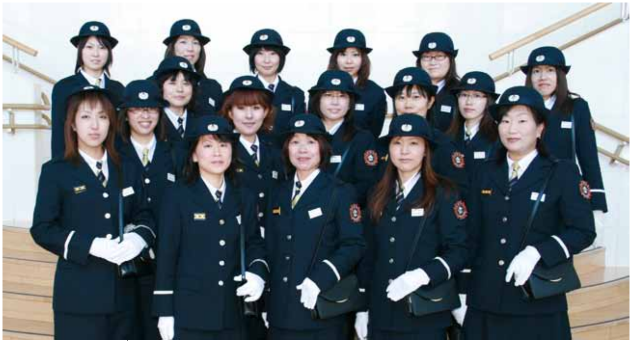
▲正装の女性消防団