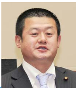
篠田 純一 議員

篠田 学校給食については稲敷市総合計画前期基本計画において安全な食材の提供に努めるとあるが、自ら食する給食の材料を選べない子どもたちを守るのは行政の責務である。それらに取り組んできた状況において、輸入食品のポストハーベストの認識と添加物に配慮した食材の提供についてどう対処しているのか。地産地消の推進にむけて平成23年度の市内および茨城県からの食材納入量について伺う。また給食の配膳方法について、給食開始時の計画にトレー対応がなされず、これまでトレー購入の予算が組まれなかったのか。更に学校給食費未納問題についてどのような対策をしているのかを問う。