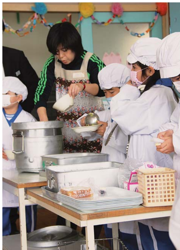
あずま北小の給食のようす

収穫後の農産物に使用する殺菌剤・防かび剤・防腐剤等で、農薬の残留割合が高く食の安全に不安を与えている。