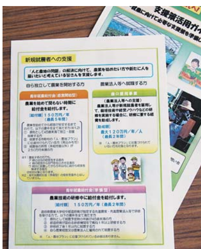
新規就農の支援となる新規事業

準備型は県が、経営開始型は市町村が事業実施主体になっており、事前の準備が大変重要である。市でもこの制度を活用し、力強い農業づくりを目指し、青年新規就農者の増加、定着への取り組みをしてはどうか、またその支援体制について市長の所見を伺いたい。