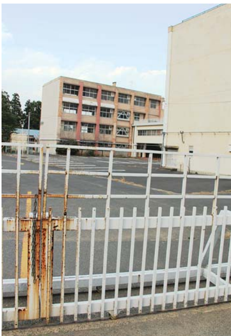
旧江戸崎西高跡地（新庁舎建設予定地）