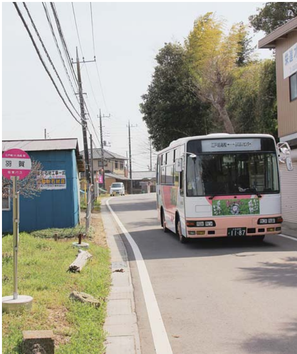
江戸崎と新利根庁舎を結ぶ江戸崎・角崎線

公共交通会議への学識経験者参加については、必要に応じて次回会議から検討します。路線ごとにデータは集積していますが、細かいデータ収集を進めていきたいと思えます。