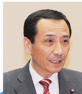
伊藤 均 議員