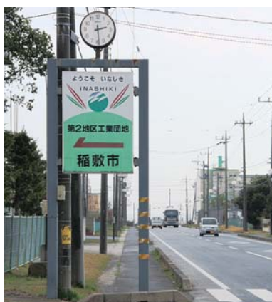
下太田第二工業団地

先に契約協議を行っていた企業との調整も不調と聞くが、再度申請があった場合の対応はどうするのか。