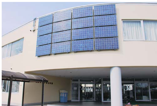
ソーラーパネルの設置された江戸崎公民館

太陽光発電住宅への設置についての助成措置制度の導入は、県内つくば市、土浦市など12市町村が導入しており、今後、関係各課と調整を図り検討していきたいと考えています。