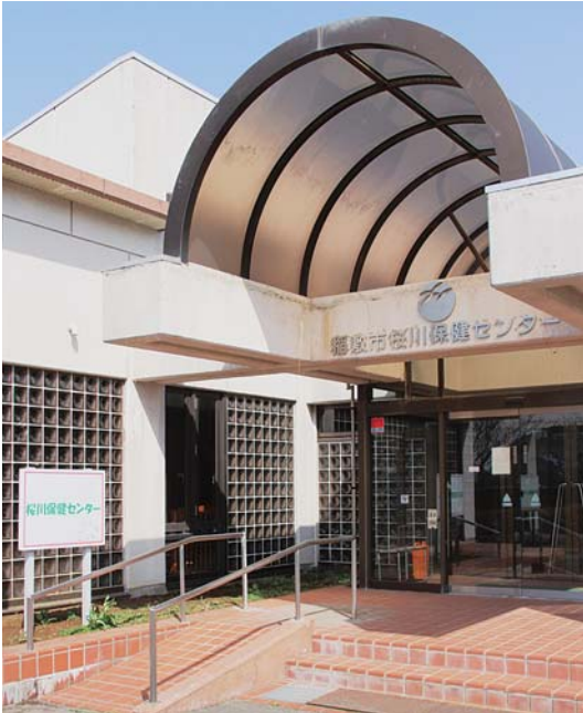
市民の健康を守る保健センター

クレアチニンは尿酸等と同様に腎臓でろ過されて尿中に排泄される物質で、採血による腎機能検査として用いられる。