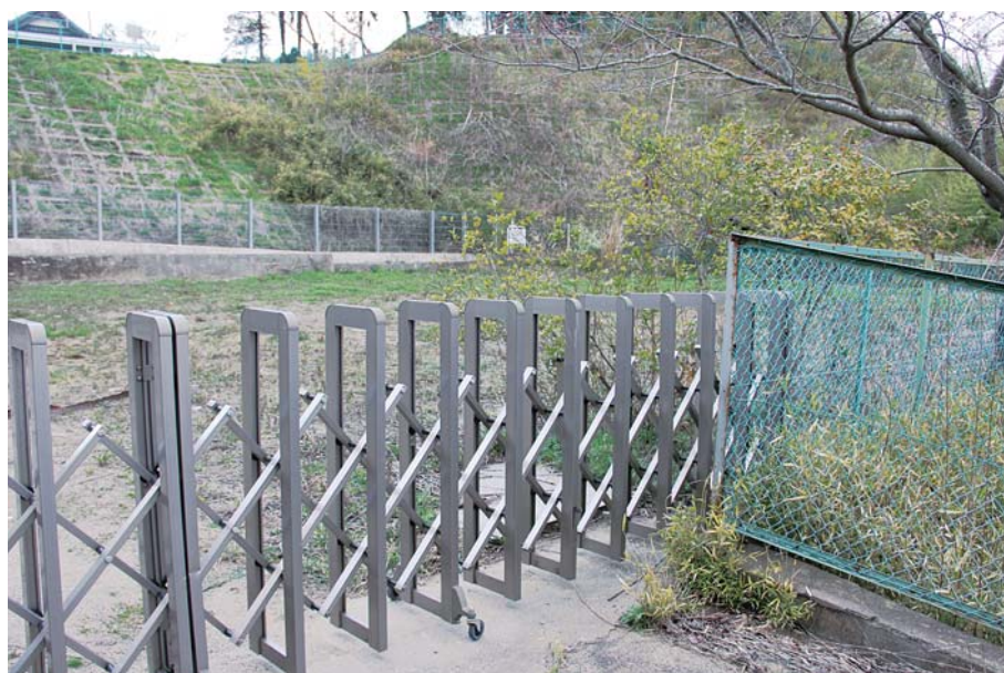
活用が望まれる旧江戸崎幼稚園跡地

財産運用の基本方針としては原則処分。ただし避難場所の位置づけ施設は防災広場や避難所として改修整備します。廃止施設は他の用途目的活用を判断し、次に避難施設を兼ねた地域コミュニティ施設としての貸出しや譲渡、利活用が見込めない場合は売却処分をすることになります。