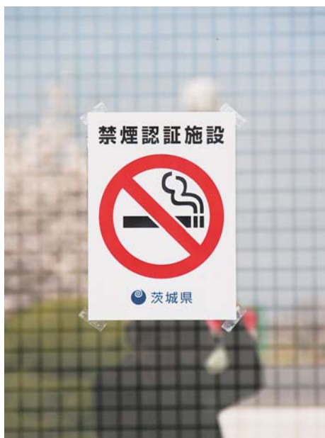
茨城県禁煙認証施設（東保健センター）

受動喫煙防止に対する職員への指導については、知識やマナーを徹底させるため、意識向上の講習会等に積極的に取り組んでいきたいと考えています。