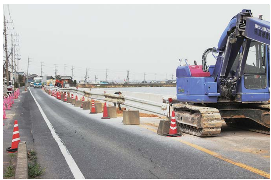
復旧の進む国道125号線

また、課題としては市民に 対しての避難所や給水場所の 情報等を、迅速に提供するこ とが最も重要です。 今後は、災害時に臨機に対 応できる仕組み作りを取り入 れた防災計画の見直しを図り、 また、ハード面では、公共施 設の耐震化や液状化対策に取 り組んでいきたいと考えてい ます。