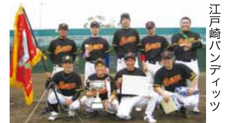
江戸崎バンディッツ