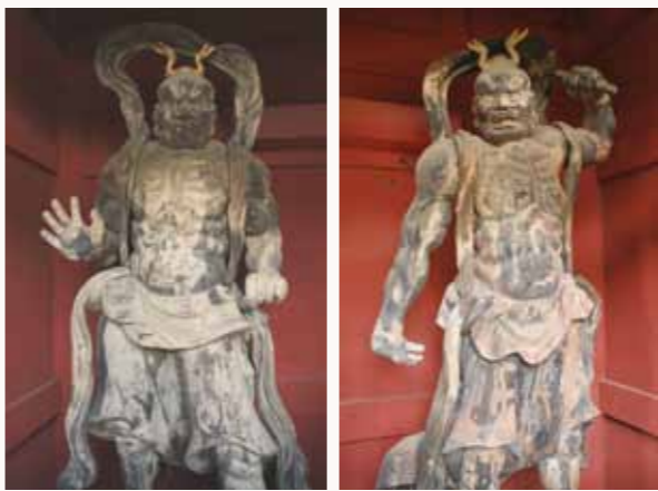
①逢善寺仁王像