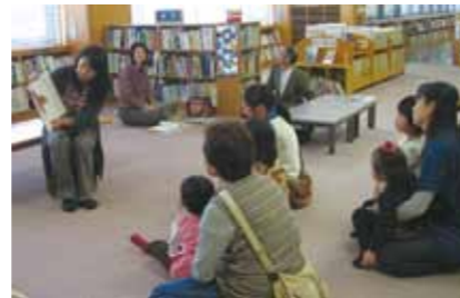
△ボランティアさんによる読み聞かせ