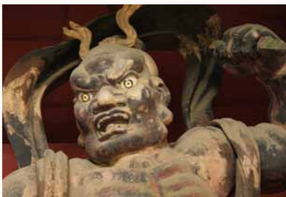
②阿形の頭部