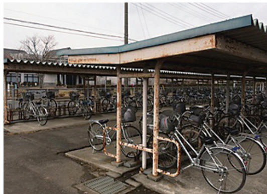
サビがひどい駐輪場