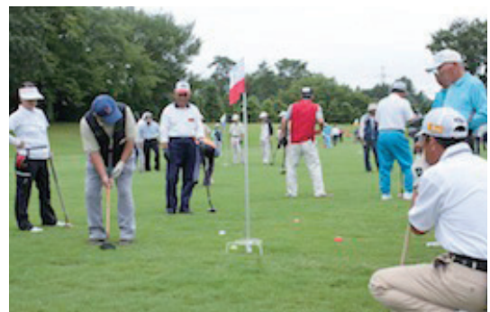
グラウンドゴルフを楽しむ皆さん

保健福祉部長 市が主催する大会はございませんが、高齢者の生きがいと健康づくりを目的とした、老人クラブ連合会主催と、体育協会主催の2種類の大会があり、年4回の大会が開催されております。