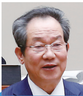
山口 清吉 議員

市長 景気回復の期待感の中、物価や賃金についての不安感も指摘されています。今後の国の施策を注視していきます。稲敷市の対応としては、今回示されたアンケート結果を真摯に受け止め、財源を確保し、市民のために必要な事業はしっかりと取り組みを進めていきます。