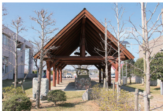
国際交流にて建設された「友情の家」

また、東京オリンピック・パラリンピックの開催にあたり、スポーツ振興に向けたタイアップ等の企画はありませんが、来たる茨城国体において市では、トランポリン競技が予定されており、スポーツの共通性を生かした交流を検討してまいります。