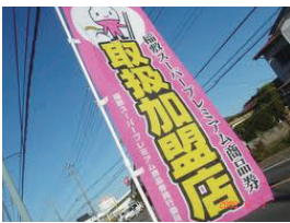
20%プレミアム商品券発行を実施

総務部長 地域における消費喚起、生活支援を推進する交付金として約8,100万円が交付されます。市としては、20%のプレミアム率の商品券発行事業に活用する予定です。