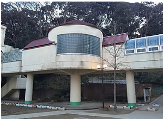
求められる学校施設整備

副市長 学校の施設や環境を整え、きれいな学校にすることは、子どもたちにとって大切だと考えます。また、少子化・人口減少対策の観点からも、学校は大きな要因であり、重要であると考えます。稲敷市の学校に行きたいと思えるように何が出来るかを検討していきます。