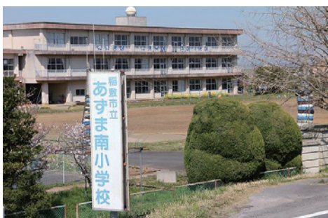
説明会が行われたあずま南小学校