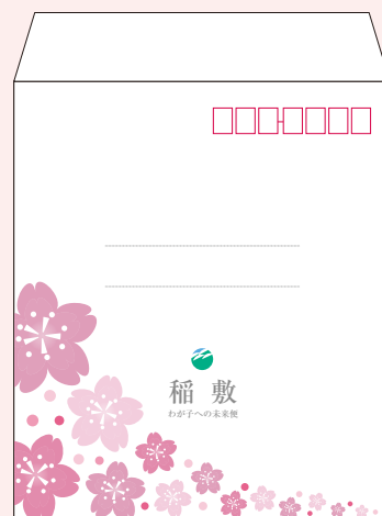
未来のお子様宛の封筒

(わが子への未来便セットには、便せん、本状、封筒の他、事業申込書、市役所宛の返信用封筒が入っています。)