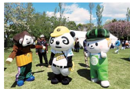
稲敷市を代表して仲よし仲間、ウキラ星人・井井・稲敷いなすけの3ショット。