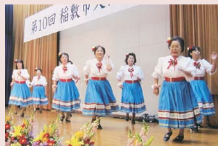
稲敷市の文化祭で披露しました。