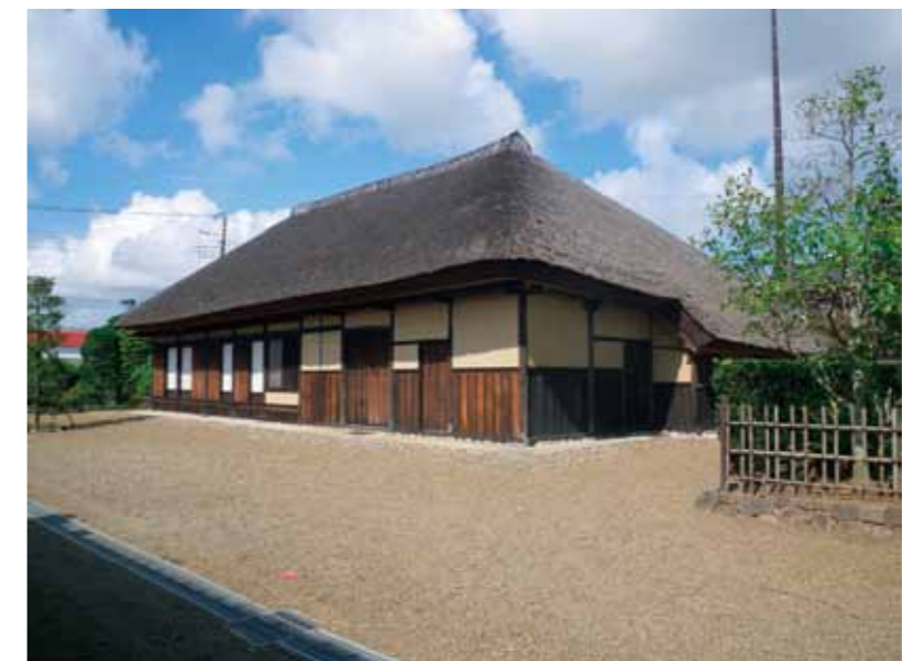
国指定重要文化財 平井家住宅