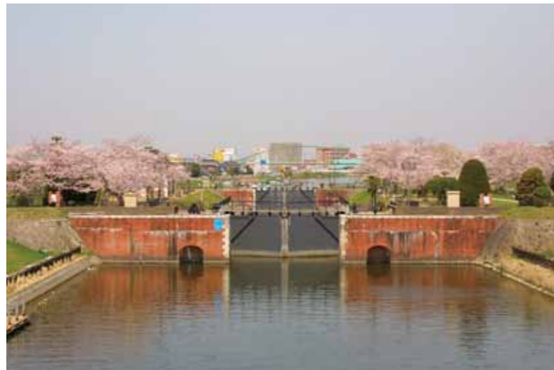
国指定重要文化財 横利根閘門

住宅建築、砂利採取事業、開発行為等に伴う地下埋蔵文化財の有無の照会事務に伴う、試掘調査や埋蔵文化財保護法による届出等の将来的に継続する、埋蔵文化財の保護活動の事務の円滑化が最大の課題となっています。