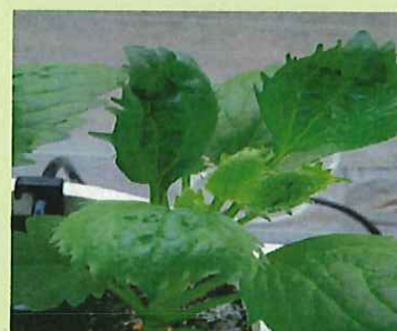
品目：アスター 症状：葉の異常