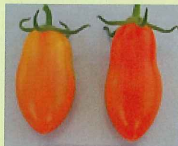
品目：ミニトマト 症状：果実が細長く変形