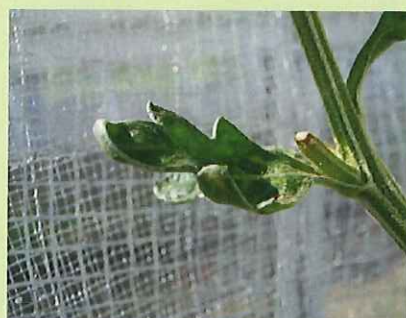
品目：きく 症状：葉の異常