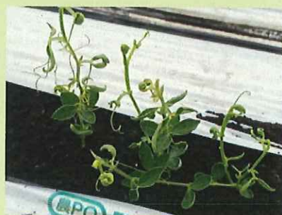
品目：スイートピー 症状：葉の異常