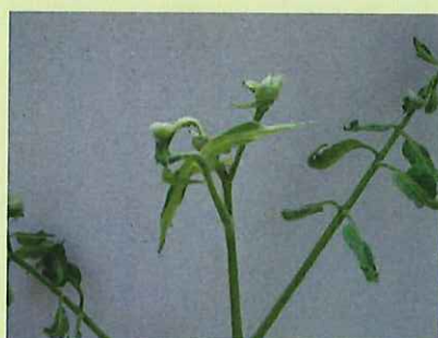
品目：トマト 症状：葉の異常