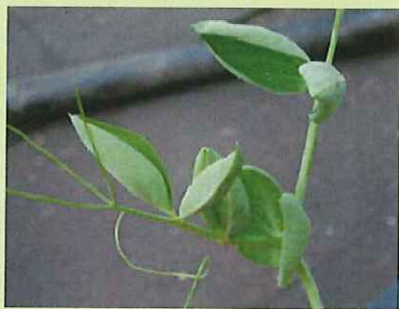
品目：さやえんどう 症状：葉がカップ状になる