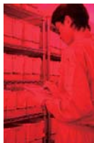
四季を再現した部屋で管理される国産マルハナバチ

さまざまな種類の昆虫たちの能力に、驚かされました。詳細についてはJAやアグリセクトに問い合わせてください。ありがとうございます。