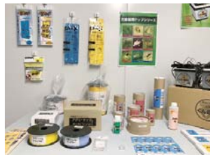
昆虫だけでなく多種類の商品も展開しています

天敵のイサエアヒメコバチ等の天敵生物製剤を扱っています。その他に害虫を色で誘い寄せて捕虫する粘着捕虫資材、うどんこ病等を予防するための硫黄くん煙器等も販売していて、実際に市内の農家さんに使用していただいています。