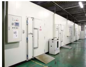
多種類の昆虫の研究・飼育を行うための先進設備を導入しています