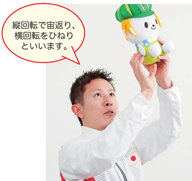
縦回転で宙返り、横回転をひねりといえます。