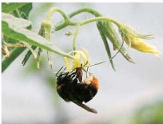
トマトの花粉を集めるマルハナバチ

植物の花粉を運んで授粉させる昆虫として、マルハナバチがあげられます。ハウスなど施設栽培で用いて、農家さんが手作業で行う授粉作業をマ