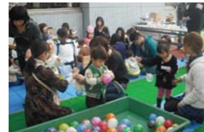
△あいアイフェスティバル