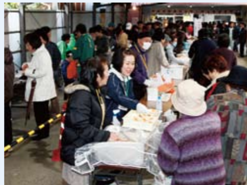
11月号でもお伝えした、今年のあげ餅自慢大会。2月26日には、昨年以上の賑わいが期待されます。(写真は昨年の第1回あげ餅自慢大会)