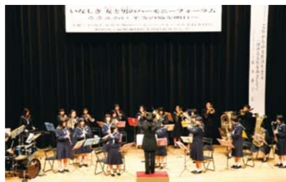
▲オープニングを飾ってくれた新利根中学校のプラスバンド部