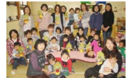
△クリスマス・アレンジメント作成