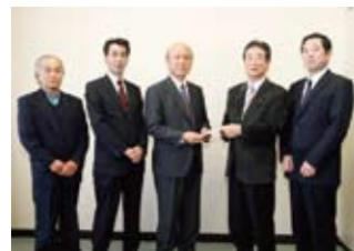
△聖苑香澄売店組合

橋」となって、事業を展開しています。使用済み切手は、茨城県社会福祉協議会で取りまとめ、県内のボランティア活動団体に助成されます。(敬称略・順不同、10月1日～11月30日) 稲敷市商工会チャリティーゴルフ大会 = 48,570円、「空の日」・「空の旬間」記念事業 成田地区実行委員会 = 100,000円、稲敷盆栽会 = 14,500円、