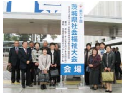
△県社会福祉大会に参加

ひめゆり会、デイサービスボランティア、桜川更生保護女性の会、東ボランティア白ゆり会議