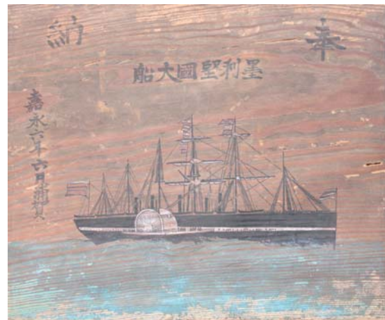
吉田松陰 奉納の絵馬