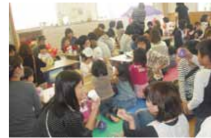
△146人の親子が参加した“あいアイフェスティバル”