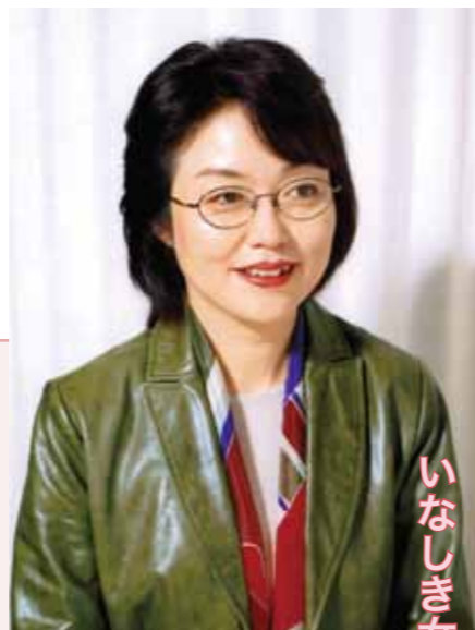
ご参加ください いなしき女と男のハーモニーフォーラム

東京都杉並区生まれ。早稲田大学政治経済学部卒業後、1982年から1987年まで神奈川新聞社で社会部記者として警察取材や連載企画などを担当。29歳で退社しフリーライターとなる。平成7年、菊池寛賞受賞。平成19年より獨協大学経済学部経済学科特任教授に就任。国際情勢や国内の社会問題に関して活発な言論活動を展開している。