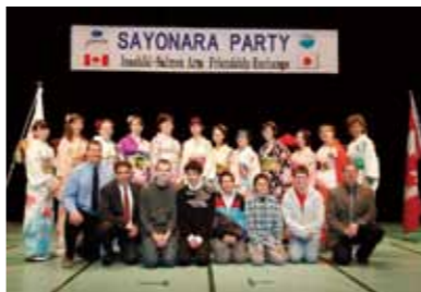
△平成22年の受け入れの様子

団員の子も達をホームステイさせていただける「ホストファミリー」を募集します。受け入れの際には、特に個室やベッド、洋食などを用意する必要はありません。一般的な日本家庭での生活体験を楽しみにしてきますので、気軽に友達として接してください。