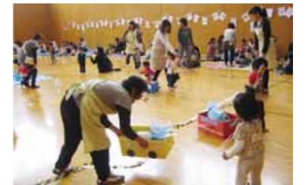
△子育て運動会の様子

▽日時：12月21日(水) 午前10時20分~ ▽場所：支援センターひまわり(江戸崎) ▽申込方法：12月19日(月)までにつばさ・ひまわりへ申し込む