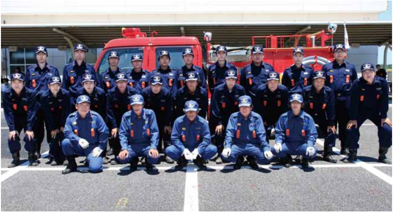
▲ 第4方面隊本部員と各分団長