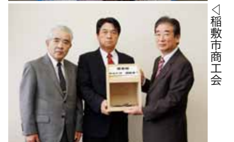
＜(株)千葉ヤクルト販売