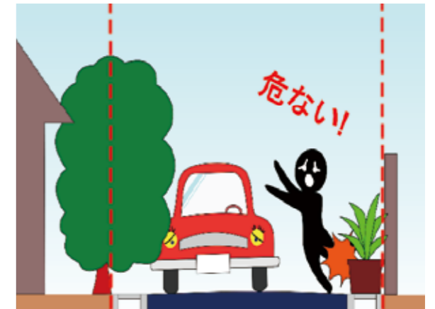
△道路にはみ出した樹木は、車や歩行者の通行や視界の妨げになり、大変危険です。せっかくのきれいな花も人の迷惑になっては台無しです。