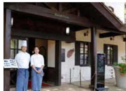
皆さまのご来店をお待ちしております。