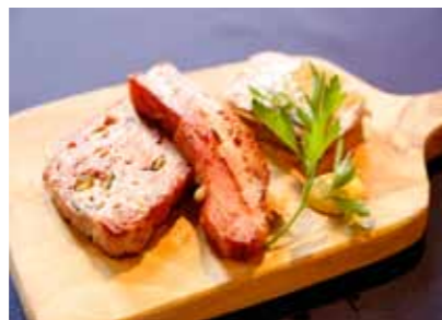
厚切りベーコンは、大きくて一度味わったら忘れられません。