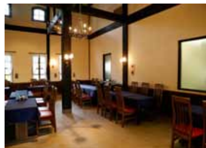
おしゃれな雰囲気ファミリーにもちろんデートにもオススメ。