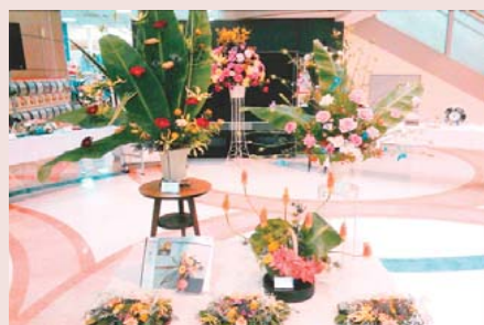
先生の指導のもと、アレンジメントを楽しむサークルの皆さん。