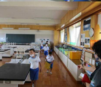
2年生が1年生を案内している様子