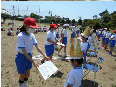
王冠と校歌の色紙を渡している様子