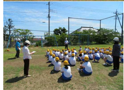
避難した後、まず全体で反省している様子