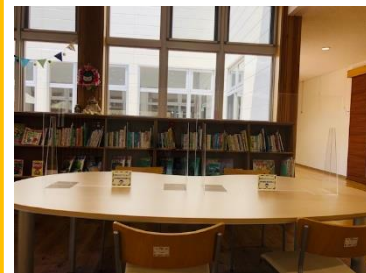
大きいテーブルには アクリル板を設置