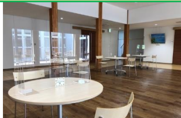
座席数を減らし、アクリル板を設置