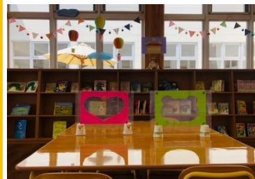
小さいテーブルには かわいい仕切り板