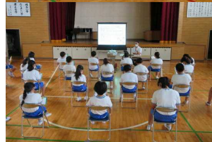
薬物乱用の恐ろしさについて学んでいる様子