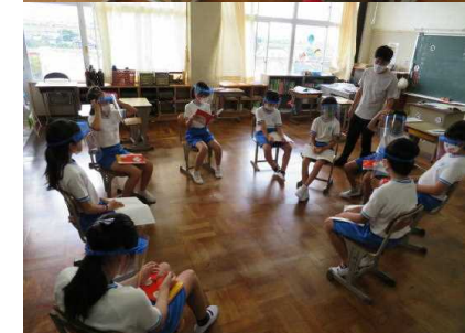
(上)4年生国語(ペア) (下)4年生社会(グループ)