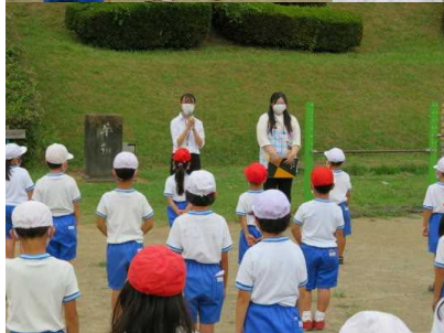
2人で教育実習生が自己紹介をしている様子