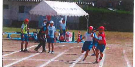
紅白対抗リレー(代表)