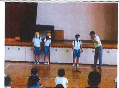
不審者に遭遇したときの対応を学んでいる様子