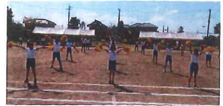
いばきらダンス(4~6年・表現)