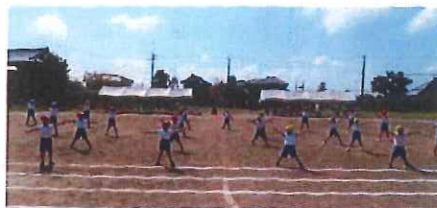
ドラえもん(1~3年・表現)