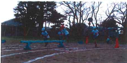
あにまるだっしゅ(1・2年)