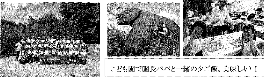
こども園で園長パパと一緒に夕ご飯。美味しい！

2日目はこども園周辺のお散歩からスタートし、朝の気持ち良さを感じて清々しい表情を浮かべていた子どもたちです。朝ご飯を食べた後は記念品製作としてフォトフレーム作りをし、素敵な作品が完成しました♪ 一人ひとりが助け合いながら協力する姿が見られ、成長を感じた2日間でした。