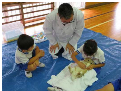
一人ずつうさぎの心音を聴いている様子

3人の動物病院の先生方から、うさぎの心音の聴き方を教えていただきました。命の大切さを感じることができました。