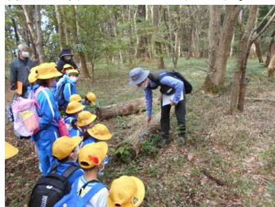
牛久自然観察の森を案内していただいている様子

森の自然に触れたり、夢中になって公園で遊んだりしました。友達との仲も一層深まったようです。