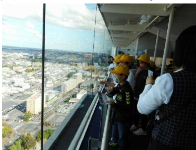
県庁展望ロビーから眺めている様子

笠間焼の体験と茨城県庁の見学をしました。県庁では、県議会議場も見学することができました。