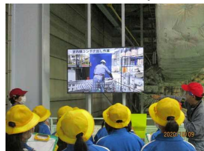
工場の作業の様子をモニター越しに見学している様子

釜井にある地元の工場を見学しました。電化製品のリサイクルの方法を知ることができました。