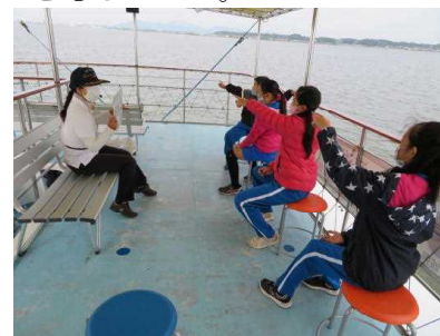
霞ヶ浦の船上で学習している様子

2カ所で水に関する学習をしました。「水を大切にする」という強い思いをもちました。