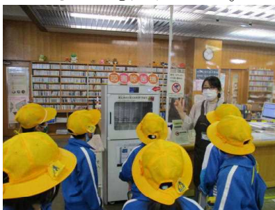
館内を見学している様子

図書館の中を見学しました。安全に本を貸し出すために、除菌機を設置していることも知りました。