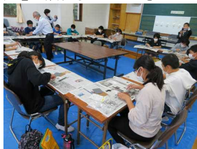
勾玉を製作している様子

火起こし体験、勾玉作り、古墳や出土品の見学などを行い、昔の人々の知恵に触れることができました。