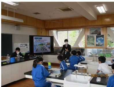
下水処理場の仕組みを聞いている様子

土木部営繕課の方から、下水道の仕組みを教えていただきました。水がきれいになる実験も見せていただきました。