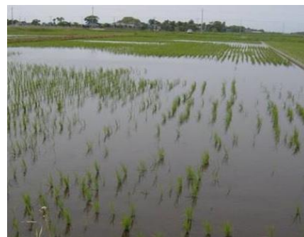
食害を受けた水田