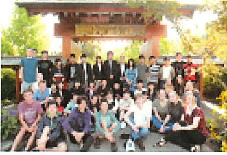
企画運営、随行協力

姉妹都市であるカナダ・サーモンアーム市との交流事業を支援する組織として活動している団体です。 派遣・受入事業への協力や事前研修、広報活動など両市の友好親善のため様々な活動を行っています。