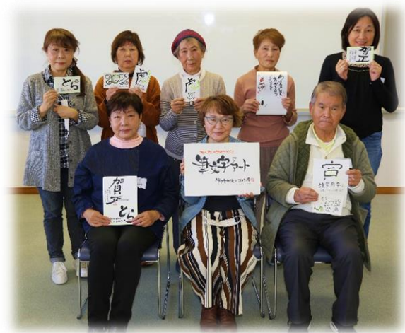
「オリジナルポチ袋」作品

筆文字アート講座では、年賀状とオリジナルポチ袋を作成しました。 皆様、夢中になって何枚も何枚もアイデアを形にし、とっても素敵な作品が完成いたしました。