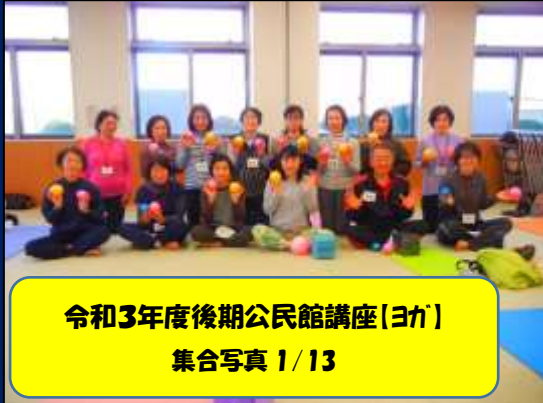
令和3年度後期公民館講座(ヨガ) 集合写真 1/13