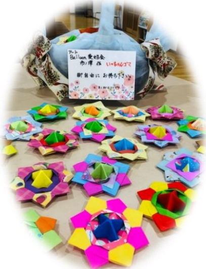
桜川公民館で活動している