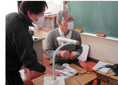
理科支援の先生が模擬実験を配信している様子

模擬実験の配信を通して、電気が光や熱、音、運動などに変換することを学習しました。電気を蓄電池にためることができることも学びました。