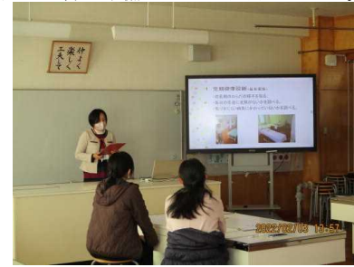
養護教諭が保健調査票の提出について説明している様子

来年度入学する8名の保護者に集まっていただきました。入学後の学校生活の様子や入学前の心得と準備について説明しました。