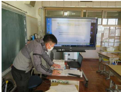
いばらきオンラインスタディの動画を使って授業をしている様子

「〇〇は〇〇の長さの何倍」について、学習しました。練習問題にも多く取り組み、知識の定着を図りました。