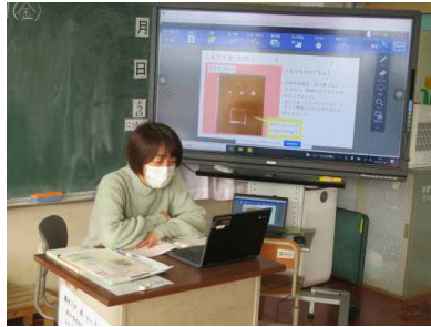
どのように見つけていくのか例を基に説明している様子

周りにある物を見て、顔に見えるところを探し活動に取り組みました。探した物を写真に撮って、その特徴をワークシートに記入し、発表しました。