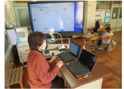
各自がまとめた表を共有し全体で共通理解している様子

モンゴルの家の材料やつくり方の工夫と、その土地の特徴や人々のくらしを分けた表を作りました。それらを全体で見合い、1つにまとめていきました。