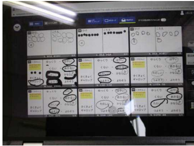
入力した各自のワークシートを共有している様子

「ギャロップ」という曲を鑑賞しました。かけ声と呼びかけの場所を確認し、感じた印象をワークシートに記入し、意見交換しました。