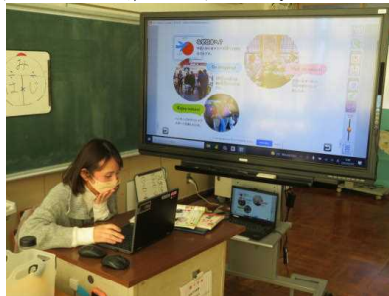
外国人旅行者が日本を訪れる目的を考え発表している様子

担任とALTのディプティ先生と授業を進めました。外国人旅行者が日本を訪れる理由には様々あることを、児童たちは理解したようでした。