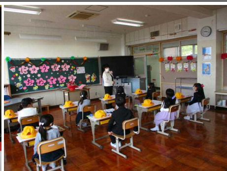
学級活動で担任の先生の話をお聞いている様子