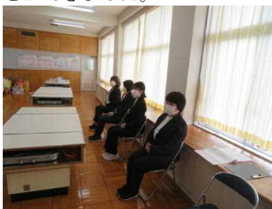
新任式で一人ずつ自己紹介している様子

家庭科室からのオンライン放送という形で行いました。子どもたちは画面越しに、真剣に式に臨むことができました。