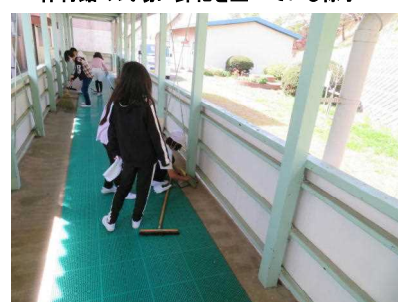
体育館への通路を掃除している様子