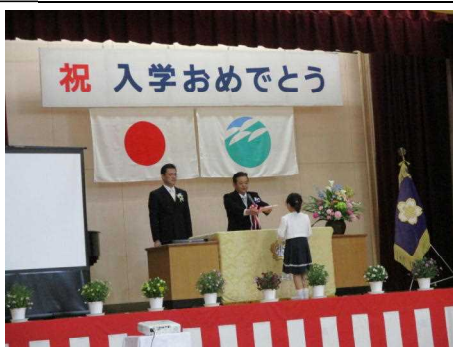
教科書給与で代表児童が受け取っている様子

新入生は、緊張した表情を見せながらも、これからの学校生活に対する希望に満ちた表情でした。8名全員が、式の最初から最後までしっかりとした態度で臨むことができ、大変素晴らしかったです。また、入学式終了後の教室での学級活動でも、担任の先生の話に耳を傾け、真剣に聞いている姿も素晴らしかったです。