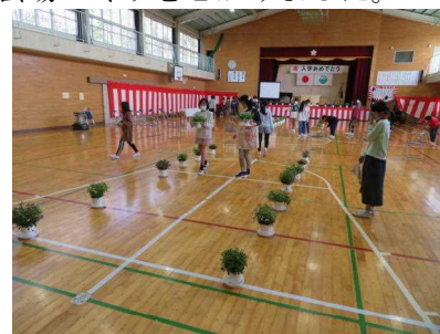
体育館の式場に鉢花を並べている様子

上学年が入学式の会場準備を行いました。入学式当日に参加できない分、新入生のためにきれいな会場づくりを心がけました。