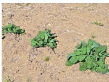
昨年12月に種まき(表紙写真)した「からし菜」 4月7日撮影

今年は、何かしら野菜の栽培を行い、また幼稚園児に収穫体験をしていただければと考えています。