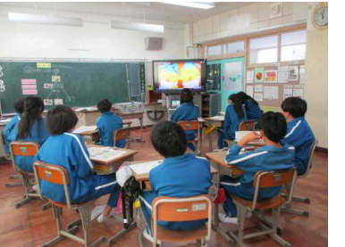
動画を見て税金について学んでいる様子

税金がなかったらどんな世界になるのかを動画を視聴しながら考え、税金の大切さについて学ぶことができました。