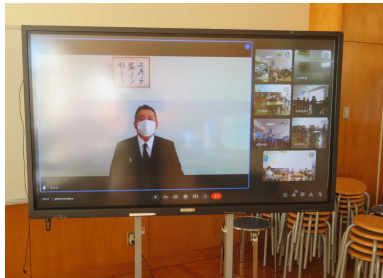
リモートでの「終わりの会」の様子

校長先生からは日本の伝統的な年越し、新年の迎え方など家庭で「自分ができることを行ってほしい」という話をいただきました。