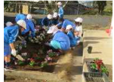
サポーターさんの協力で花を植えている様子

北小サポーター3人をお迎えし、パンジーの苗を丁寧に植えました。1, 2年生もサポーターさんの援助を受けながら一生懸命に植えていました。