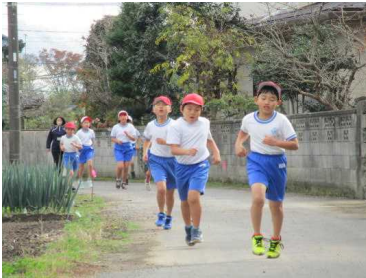
持久走記録会(中学年男子)の様子

天気にも恵まれた、持久走記録会を行いました。つらくても最後まで頑張る姿勢や走っていないときは走っている学年を応援するなど児童の良い点が多く見られました。