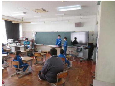
登下校を振り返っている様子(釜井支部)

5つの支部に分かれ、支部長を中心に2学期の登下校を振り返りました。また、通学路で危険な場所についても確認しました。