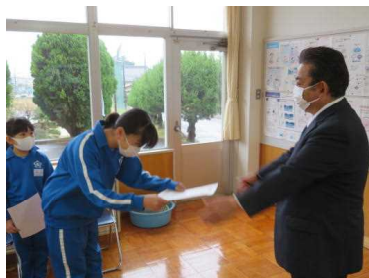
持久走記録会の各学年の1位を表彰している様子

持久走記録会で3位までに入った児童を中心に表彰しました。感染症対策としてリモートでの実施となりました。