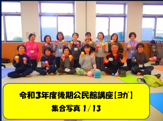
令和3年度後期公民館講座(ヨガ) 集合写真 1/13