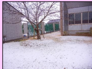
1月6日(木)午後3時ごろ

1月6日(木)、午後から雪が降りました。午後も降り続け、一面銀世界!! 日陰ではしばらくの間雪が融けず、道路はアイスバーンになり、車を運転している私はとても怖かったです。