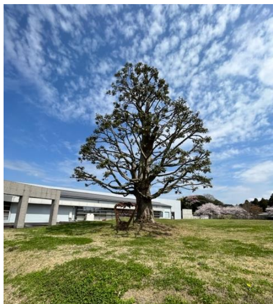
【新利根公民館のシンボル】