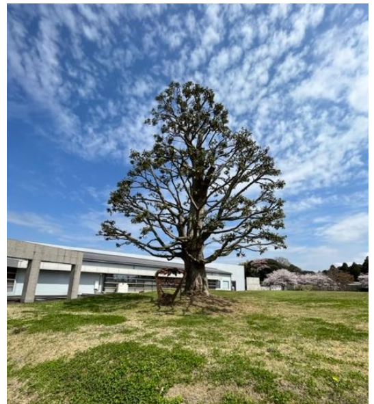
【新利根公民館のシンボル】