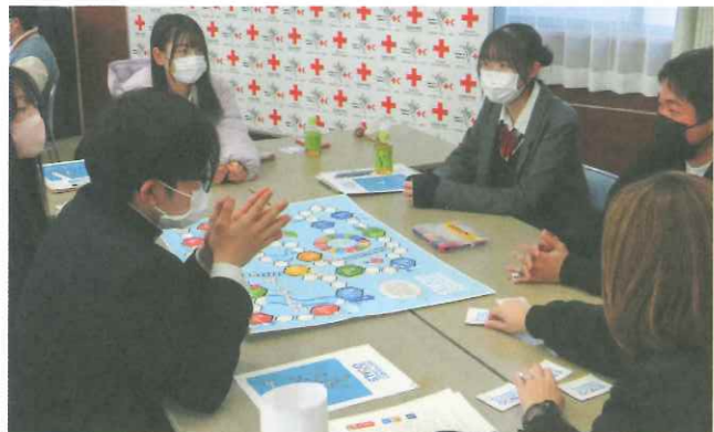
▲SDGsについて学ぶ高校生メンバー

本県では、350校、約66,000人のメンバーが、校内外での清掃活動、慰問、募金活動等の活動を通して、赤十字の心を育てています。