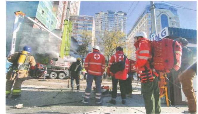
▲首都キーウで攻撃のなか、24時間体制で対応する緊急対応チーム

日本赤十字社は、資金援助に加え、ウクライナや周辺国に職員を派遣し、現地のニーズに対応した支援活動を展開しています。