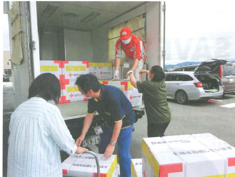
▲【令和4年8月大雨災害】救援物資を被災地に届ける日赤職員