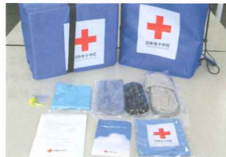
▲避難所生活に必要な救援物資(マット等)