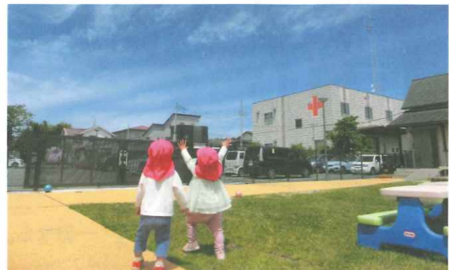
▲しゃぼん玉を追いかける乳幼児

また、乳児院では、子どもたちと一緒に遊び、授乳や離乳食を介助するボランティアが活躍しています。