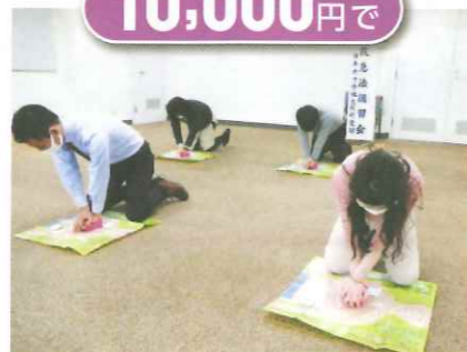
心肺蘇生トレーニングキット 6人分

資金の有効活用のため、この受領証をもって日本赤十字社の受領証にかえさせていただきます。なお、本受領証は、免税証として利用いただけます。