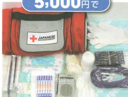
緊急セット 1セット4人分