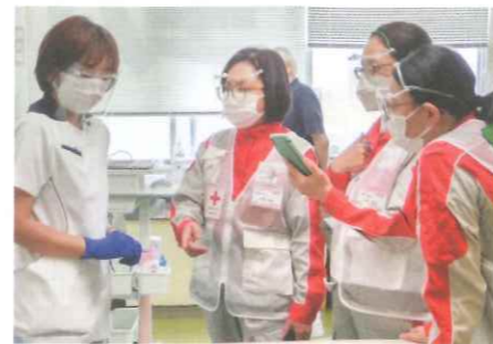
▲医療支援を行う日赤職員