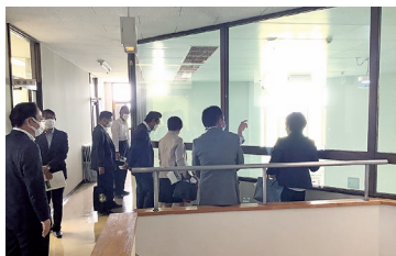
江戸崎学校給食センターの施設や厨房機器の老朽化状況を確認