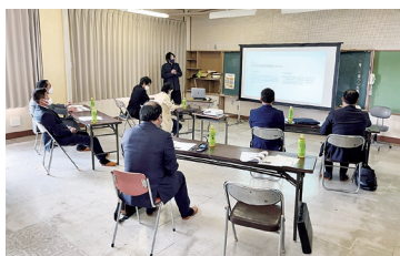
みんなの学校の事業説明・質疑 各教室で行われている作業の説明

防災倉庫を視察するため、同様のものが設置された江戸崎総合運動公園を視察しました。そこでは、災害時のコンテナの鍵開けや各家での日頃の備蓄の大切さについて呼び掛けること等について意見交換が行われました。 その後、施設や厨房機器の老朽化状況及び米飯の提供状況等の確認のため、江戸崎学校給食センターの視察を行いました。