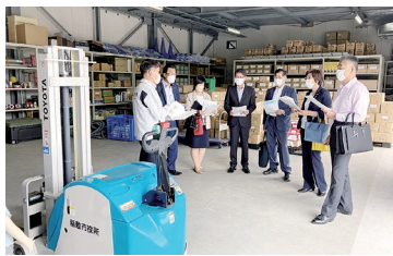
防災倉庫で備蓄品の管理・運用状況について質疑