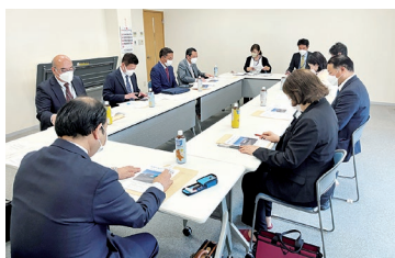
ハートピアの事業説明・質疑

稲敷市障がい者センターハートピアいなしきでは、生活介護事業の登録者が21人、就労継続支援B型事業には24人、生活訓練として 市内の障害者福祉施設の状況調査と、公共施設借用により事業を運営している社会福祉法人について、事業計画の進捗状況や施設活用状況等の実態を把握するため、4月20日に視察研修を実施しました。 （曲淵）