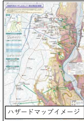
ハザードマップイメージ

ハザードマップは、市町村ごとに作成しておりますので、お住まいの市町村のホームページで確認するか、市町村の防災担当課へお問い合わせください。