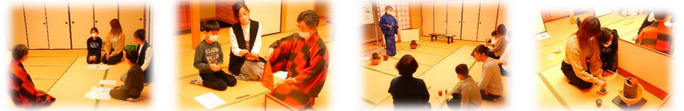
千利休のお話やお作法などを丁寧に教えていただき、おいしいお菓子もいただきました。