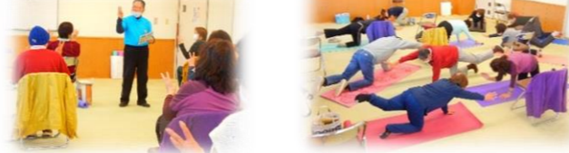
指先を使って頭の体操をしたり、体幹をきたえる体操をしたりしました。バランスを取れますか！！