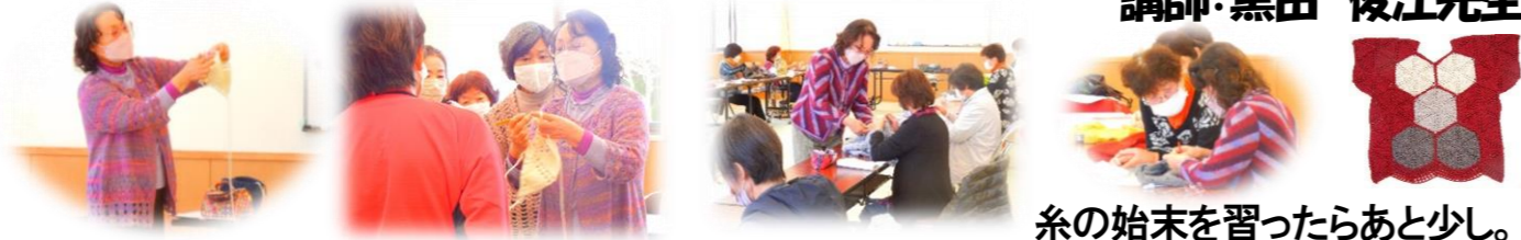
糸の始末を習ったらあと少し。