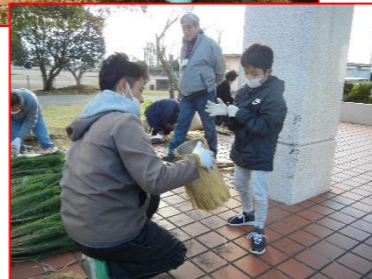
立派な門松で新年を迎えられますね！！