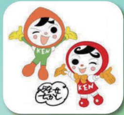
人権イメージキャラクター 人 KEN まもる君と 人 KEN あゆみちゃん