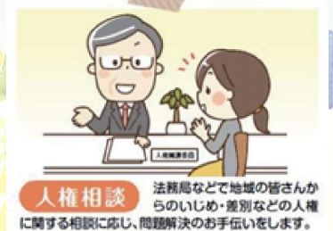
人権相談 法務局などで地域の皆さんからのいじめ・差別などの人権に関する相談に応じ、問題解決のお手伝いをします。