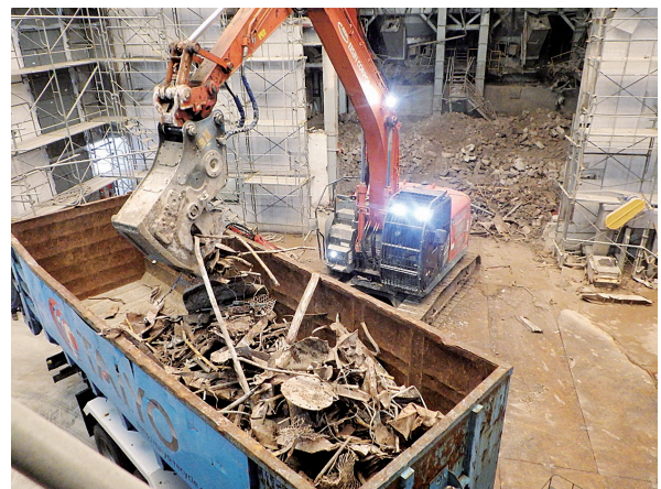
解体ヤード（表紙赤枠内）内部の様子