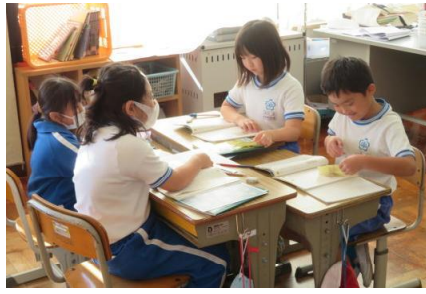
主人公の心情についてグループで発表している様子

「お手紙」の単元で、物語の中の会話文に注目して心情の変化について考えていました。それぞれ思ったことを発表し、考えを深めることができました。