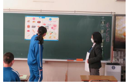
ALTと買い物の会話を行っている様子

ALT と買い物の際の会話について練習を行いました。自分が欲しいものや何に使うかなどを英語で説明することができました。英語を使った会話にも大分慣れ流ちょうに話す様子が見られました。