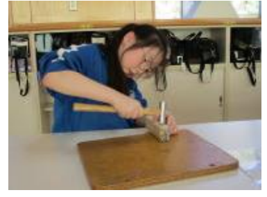
釘の頭で模様を作っている様子

「くぎうちトントン」の単元で、木材に釘を打ち、思い思いの形を作りました。初めは慣れず、曲がって打ってしまったものもありましたが、徐々に上手に釘を打てるようになってきました。