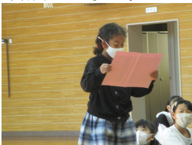
代表児童が発表している様子

代表児童が「計画的にドリルを進めたい」「友達と仲良く過ごしたい」など新年に向けての抱負を堂々と発表することができました。