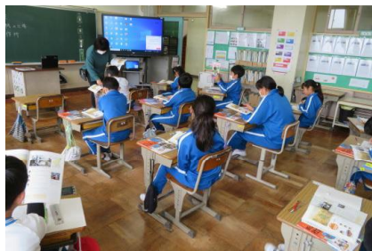
教科書から人物について確認している様子

「文化の発展につくす」の単元で、茨城県の偉人について学習していました。工業や、絵画等で発展に関わった人物について確認し、どのように関わったのかについて考えることができました。