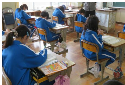
相手が納得できる言い方を考えている様子

「反対の立場を考えて意見文を書く」の単元で、書き手の考えに対して反対の立場での意見文を考えていました。お互いが納得できるようにするにはどうすればいいかを考えることができました。