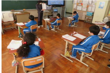
計画表を書いて発表している様子

「じぶんでできることをしよう」の単元で、自分が考えた家でできることを計画表に記入していました。「せんとくをする」「お風呂に一人ではいる」などできそうなことを計画しました。