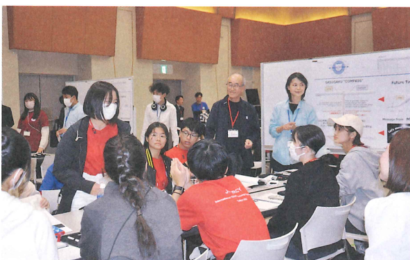
気候変動についてディスカッションするメンバー