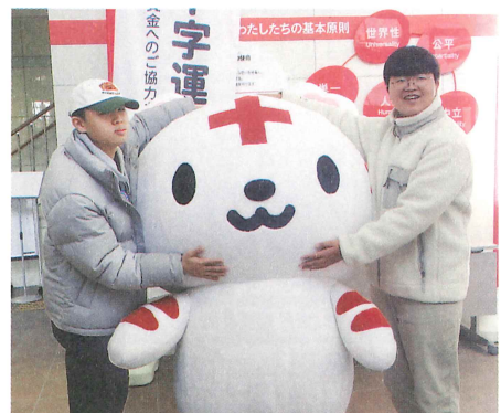
韓国メンバーとハートラちゃん