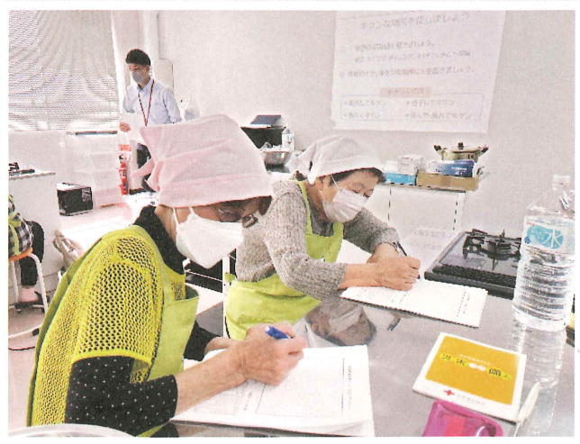
自宅内の危険な場所を確認