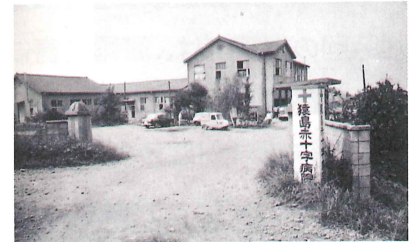
創設当時の古河(猿島)赤十字病院 昭和28年