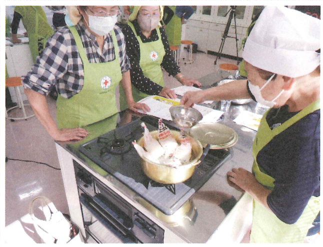
災害用炊飯袋を用いた炊き出し訓練

※2 厚生労働省が推進しているシステムで、団塊の世代が75歳以上となる2025年をめどに、重度な要介護状態となっても住み慣れた地域で自分らしい暮らしを人生の最後まで続けることができるよう、住まい・医療・介護・予防・生活支援が一体的に提供される社会システム。