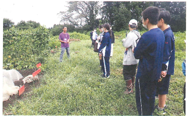
有機農業について説明を受ける

9月23日、北関東三県（茨城、栃木、群馬）支部合同の国際交流事業の一環として、各県の高校生メンバー27人と指導者5人（茨城からメンバー4人、指導者1人が参加）が栃木県那須塩原市にある「学校法人 アジア学院」を訪問しました。