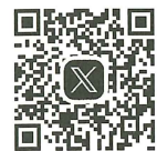
つくば献血ルーム公式SNS