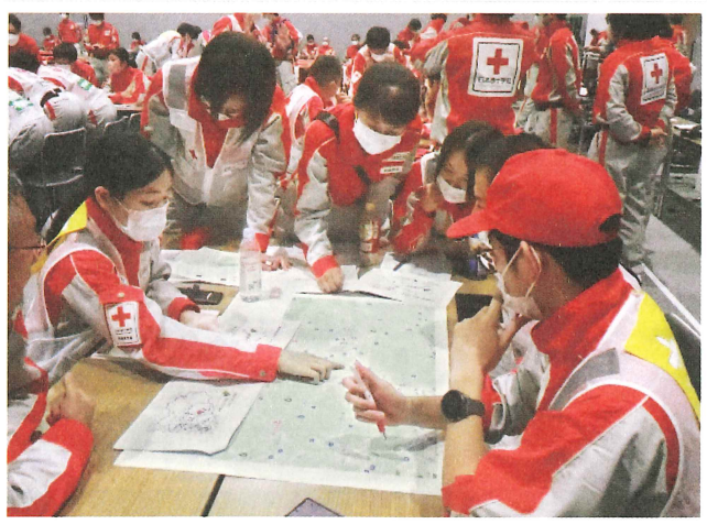
避難所までのアクセス確認

茨城県支部では、本県内で実際に災害が発生した時に、迅速かつ適切な救護活動が行えるよう、定期的に訓練を行っているほか医療資機材の整備も進めています。