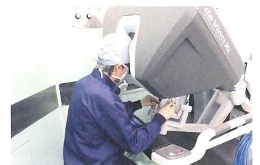
遠隔操作する医師