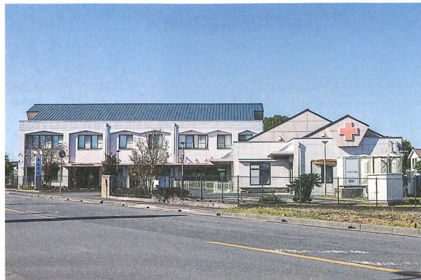
日本赤十字茨城県支部乳児院