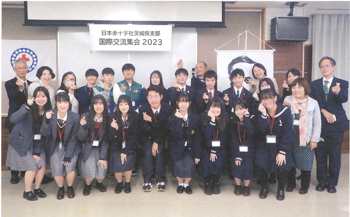
韓国の青少年赤十字（JRC）メンバーと国際親善

11月18日から22日までの5日間、大韓赤十字社(韓国)の青少年赤十字メンバー2名が当県を訪れ、青少年赤十字メンバーとの交流集会や、茨城高等学校と水戸桜ノ牧高等学校での1日体験学習に参加するとともに、青少年赤十字メンバー宅でのホームステイを行いました。