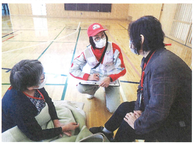
避難者への声かけ