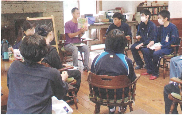
学院のスタッフから海外の文化を学ぶ