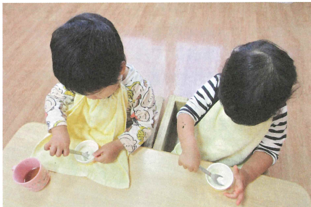
こぼしても大丈夫。たくさん食べて大きく育てね