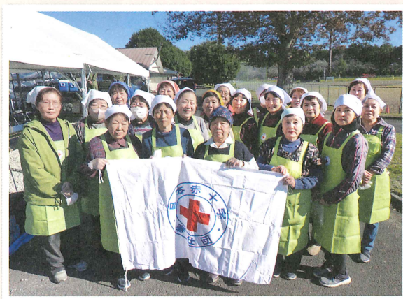
かすみがうら市地域奉仕団の皆さん

私たち奉仕団は、災害や有事の際に地域内で助け合う活動をしております。市の総合防災訓練を前に日赤茨城県支部の職員にご支援をいただき災害用炊飯袋を使用した非常食の手順を再確認しました。防災訓練当日も手際よく奉仕団一人ひとりが役割を理解し実施することができました。人と人との交流が戻ってきましたので、これからも他団体と連携を図りながら地域ニーズに応じた活動に取り組んでまいります。