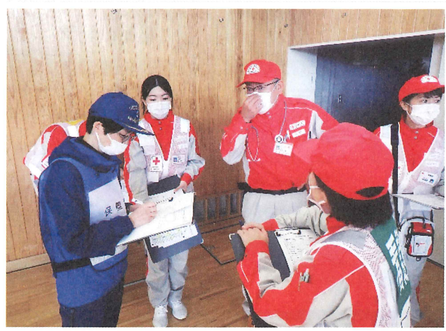
避難所の保健師との情報共有