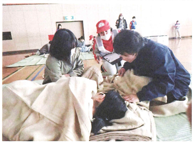
体調が悪い方への聞き取り