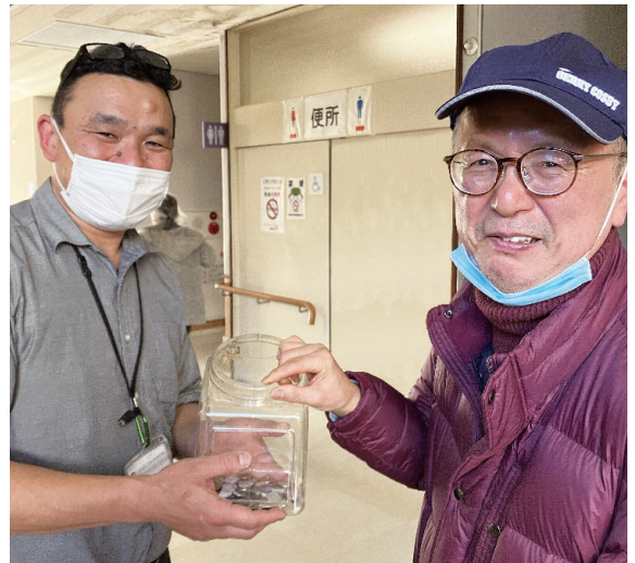
稲敷市身体障害者福祉協議会