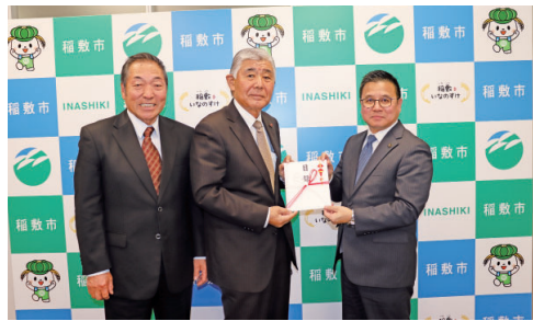
稲敷市農業委員会 様