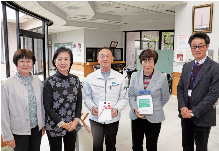
稲敷市江戸崎中学校昭和 44 年卒業生一同「若竹の会」

令和 6 年能登半島地震義援金を 1 月 4 日から開始し、義援金として多くの皆様よりご厚志を賜りました。引き続き令和 6 年 6 月 28 日（金）まで義援金の受け付けをしておりますのでご協力をお願いします。