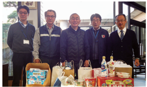
退職公務員会稲敷支部江戸崎班 様