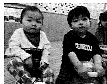
年長お別れ遠足:上野動物園

ご入園・ご進級おめでとうございます。 暖かな春の日差しの中、いよいよ新年度がスタートしました。新しいお友だちとの出会いを喜び合ったり、初めての園生活にちょっぴり不安な様子など、子どもたちの様子は様々です。新しい環境に慣れる等々心配な事もあるかと思えます。お子さま一人ひとりが安心して毎日を過ごせるよう、保育環境を整え、成長と発達に合わせた関わりを丁寧に行なって参ります。何かありましたらいつでも気軽に声がけ下さい。この1年間、お子様が健やかに成長されます姿を、保護者の皆様と喜び合えたらと思っております。認定こども園つばさ職員一同どうぞ宜しくお願い致します。