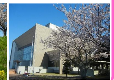
生涯学習センター