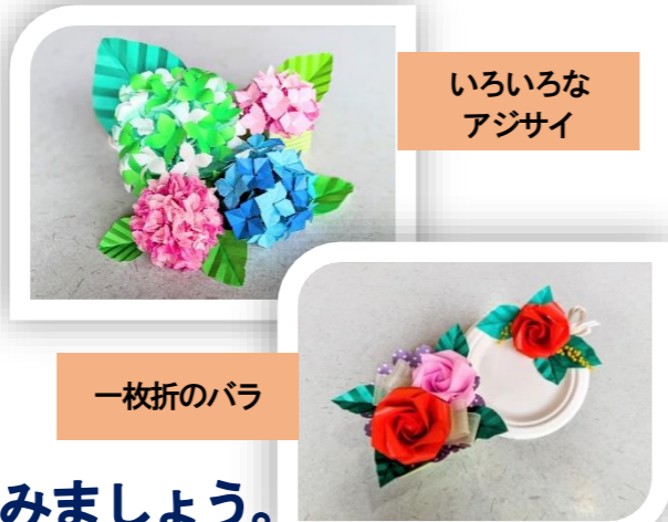
いろいろな アジサイ